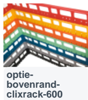
optie- bovenrand- clixrack-600