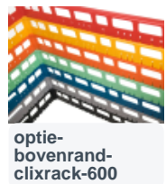
optie- bovenrand- clixrack-600